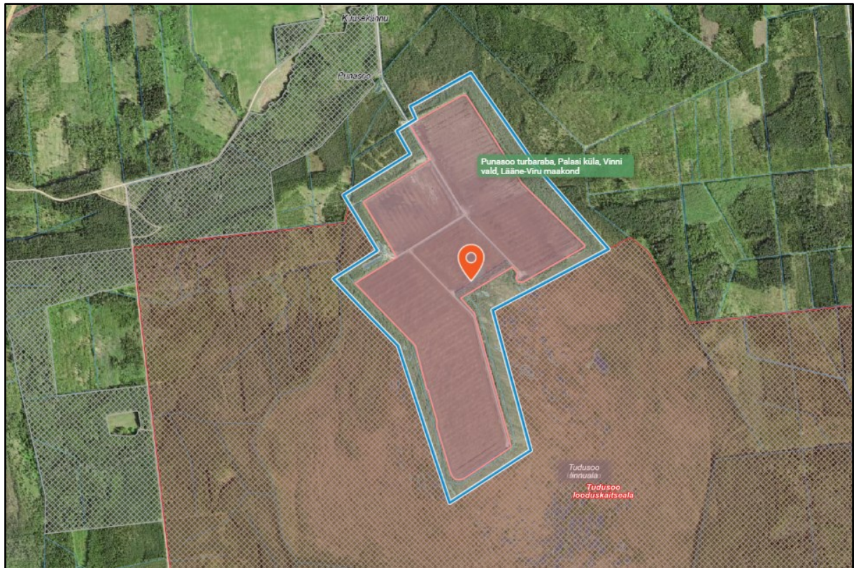
Joonis 1. Punasoo turbatootmisala mäeeraldise asukoht (Maa- ja Ruumiamet 2026)

ploki 2 vähelagunenud turba varu on 44 tuh t (sh kaevandatav varu 44 tuh t). Maavara kaevandamise maksimaalseks aastamääraks on 6 tuh t. Maavara kasutusalaadeks on aiandus ja põllumajandus. Kaevandatud maa korrastatakse taotluse kohaselt taastuvaks sooks, madalaks veekoguks ja metsamaaks 7 .